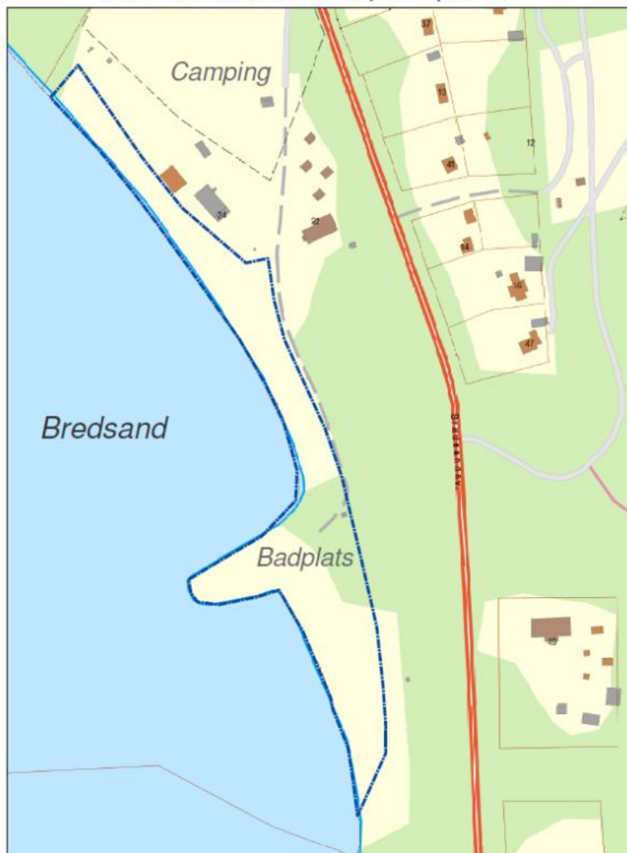
Vistelseförbud för hundar 1 maj - 30 september