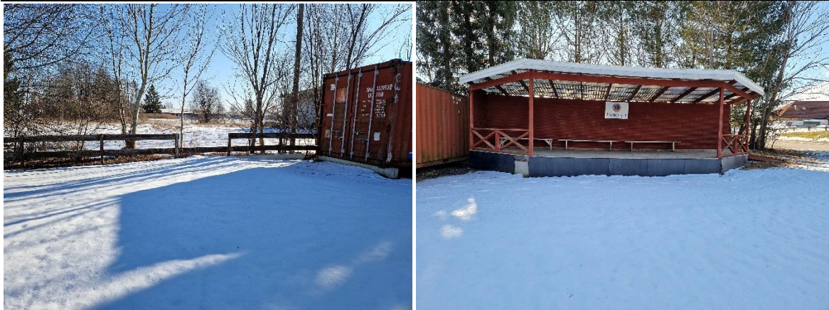
Fotografier av Liontorget vintern 2022